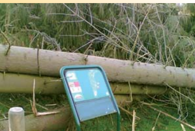
Der Abschlag von Bahn 12 ist komplett unter umgestürzten Bäumen begraben. „Vorübergehend leider kein Spielbetrieb!“