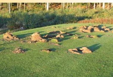
Böswillige Zerstörung: Das kostbare Grün wurde durch Spatenstiche schwer beschädigt. Schadenhöhe: 17.500 Euro