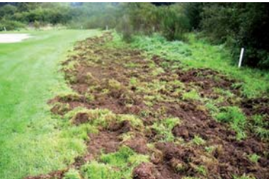
Hungrige Wildschweine haben das Fairway gründlich „umgegraben“. Schadenhöhe: 25.000 Euro